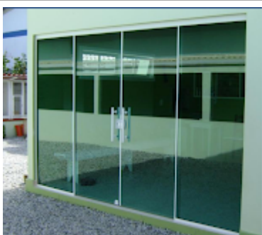
PORTA EM VIDRO TEMPERADO.png 662K

Gabriella Lourenço Carvalho Engenheira Civil CREA 18666/D-GO UniRV - Universidade de Rio Verde (064) 3620-3034 / (64) 984171988 e-mail: gabriella@unirv.edu.br